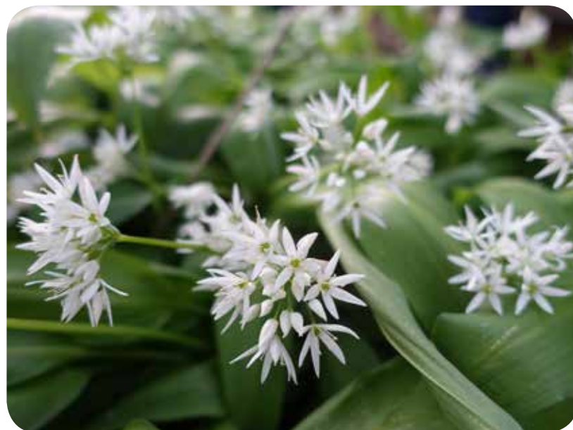
Titelbild und Bild oben: Bär-Lauch Allium ursinum

Ihr/Euer Thomas Hövelmann, Leiter der NABU-AG Botanik in Münster