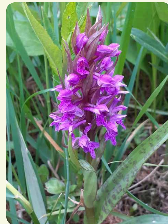
Das Breitblättrige Knabenkraut Dactylorhiza majalis

Die AG Botanik betreut seit vielen Jahren eine Sumpfdotterblumen-Wiese zwischen Roxel und Havixbeck. Bis vorletztem Jahr gehörte dazu auch die jährliche Pflegemaßnahme im Spätsommer, seit letztem Jahr hat das aber die zuständige Biologische Station im Kreis Coesfeld übernommen.