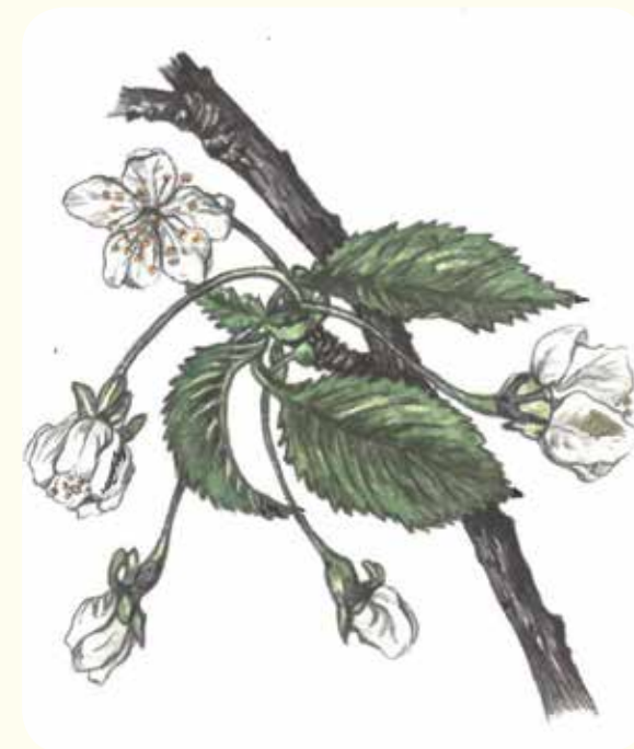
Kirschblüten (Zeichnung: Anne Thomelcik)