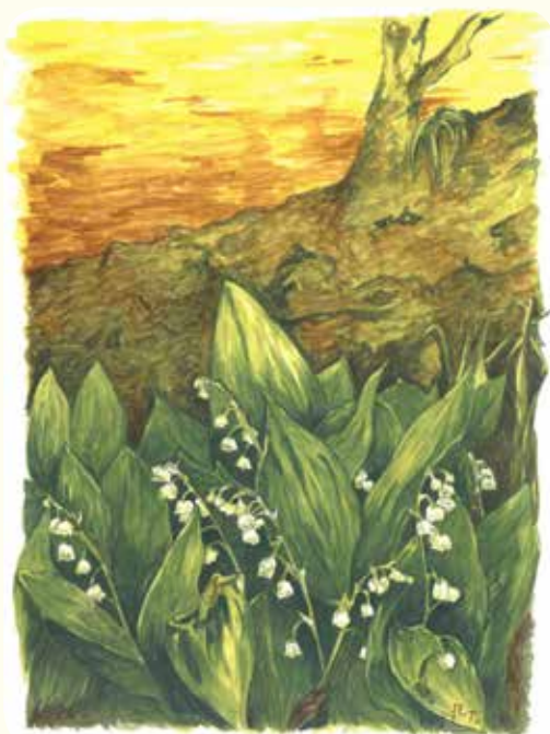
Maiglöckchen Ginster Brombeere (Zeichnungen: Anne Thomelcik)