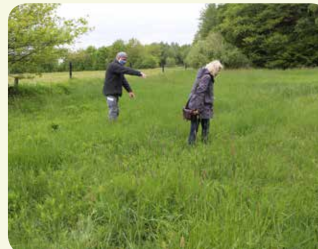
Bild: Zählung der Knabenkräuter auf der Feuchtwiese bei Havixbeck im Jahr 2020