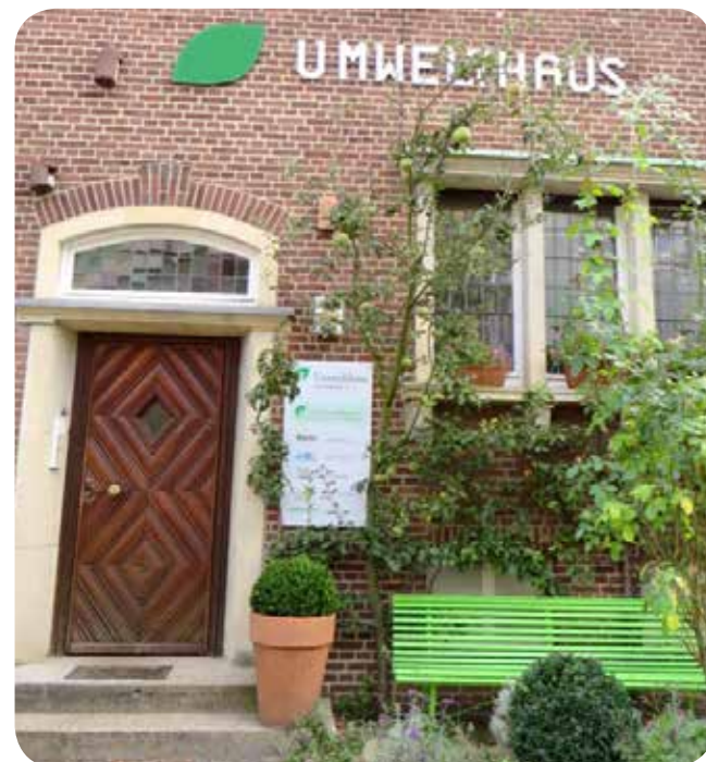
Wird 25 Jahre alt: das Umwelthaus Münster in der Zumsandstraße

Die AG Botanik stellt sich dazu für ein Fotoshooting zur Verfügung. Gesucht werden dabei Szenen, in denen wir das Schöne und Besondere unserer Arbeit zeigen können, gerne auch mit Augenmerk auf Details.