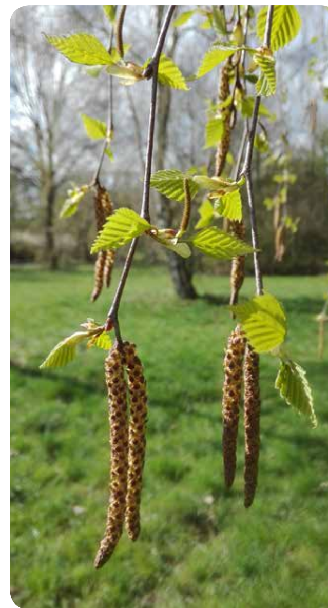
Die Hänge-Birke Betula pendula

Die Hänge-Birke gehört zu den sogenannten Pionierbaumarten. Sie besiedelt schnell freie Flächen, trotz Trockenheit und Klimaextremen - vorausgesetzt sie konnte sich „von klein auf“ daran gewöhnen - und pflanzt sich bereits mit zehn Jahren erfolgreich fort. Ihre Schnelligkeit ist ihre Chance, denn aufgrund ihres hohen Lichtbedarfs wird sie vielerorts im Lauf der Zeit von anderen Baumarten verdrängt.